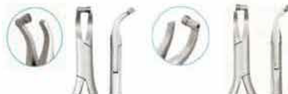
Πένσα αφαίρεσης δακτύλων καμπύλη με προστατευτικό. Ο πατενταρισμένος σχεδιασμός της διευκολύνει την αφαίρεση των δακτύλων ακόμη και στα πιο μικρά στόματα. Σε δύο τύπους A: αριστερή. Code DBHL LEFT KO-349-140-LHMK B: δεξιά Code DBHR RIGHT KO-349-000-RHMK