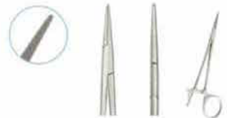
Βελονοκότοχο ευθύ πολύ λεπτό τύπου Mosquito για τις ελαστικές προσδέσεις. Code MOSFM KN-321-120-PMK (KN-320-120-PMK)