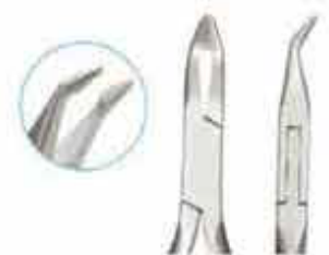
Πένσα συγκράτησης σύρματος τύπου Weingard German Style Code: WEING KP-039-140-HPMK WEINGTC KP - 939-140-HPZMK