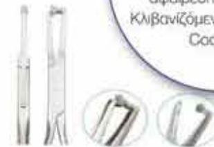
Πένσα αφαίρεσης δακτύλων & κονίας ευθεία με προστατευτικό. Με ειδική καμπυλότητα στα σκέλη της για να αφαιρεί τις περισσειές της κονίας χωρίς να καταστρέφει το δόντι. Code DBHG KO-946-000-HPZMK