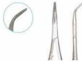
Βελονοκότοχο καμπύλο πολύ λεπτό τύπου Mathieu για τις ελαστικές προσδέσεις. Το ιδανικό εργαλείο για την γλωσσική τεχνική. Code MACF KO-001-140-ZMK