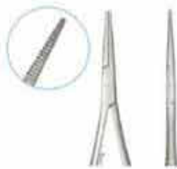
Βελονοκότοχο ευθύ πολύ λεπτό τύπου Mathieu για τις ελαστικές προσδέσεις. Code MASF KO-001-140-PMK