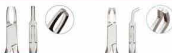
Πένσα αφαίρεσης αγκίστρων ευθεία. Αφαιρεί τα τόσο τα μεταλλικά όσο και τα κεραμικά μπράκετ εύκολα. Code: DBRS KP-013-135-PMK Πένσα αφαίρεσης αγκίστρων κεκομμένη. Αφαιρεί τα τόσο τα μεταλλικά όσο και τα κεραμικά μπράκετ εύκολα. Η ιδανική πένσα αφαίρεσης των σωληνίσκων αλλά και των γλωσσικών αγκίστρων. Code: DBRC KP-013-135-ZMK