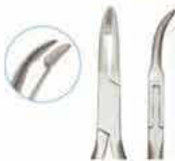
Πένσα συγκράτησης σύρματος τύπου Weingard. Διατίθεται και με ενισχυμένα άκρα βολφραμίου. Code WEIN KP-504-145-PMK