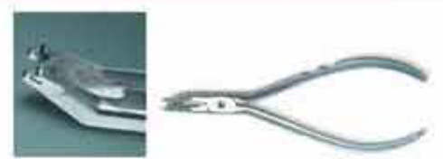
Πένσα αφαίρεσης ζαφειρέων και κεραμικών αγκίστρων κεκομμένη. Αφαιρεί εύκολα τα μπράκετ χωρίς να τα καταστρέφει. Προσοχή τα άγκιστρα πρέπει να αφαιρούνται με το σύρμα και τις ελαστικές προσδέσεις. Code: MISO