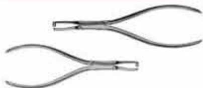
Πένσα αφαίρεσης δακτύλων ευθεία χωρίς προστατευτικό. Σε δύο τύπους A: αριστερά με μακρύ σκέλος. Code DBL KO-347-140-PB B: δεξιά με κοντό σκέλος. Code DBS KO-247-140-PT