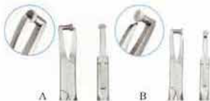
Πένσα αφαίρεσης δακτύλων ευθεία με προστατευτικό. Σε δύο τύπους A: αριστερά με μακρύ σκέλος. Code DBH KO-348-140-PMK B: δεξιά με κοντό σκέλος. Code DBHS KO-248-140-PMK

Ανταλλακτικό προστατευτικό για το άκρο των λαβίδων αφαίρεσης δακτύλων. Κλιβανιζόμενο μέχρι 180°C. Code HAT