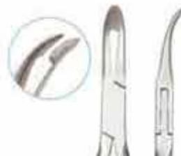
Πένσα συγκράτησης σύρματος τύπου Weingard λεπτή. Code: WEINF KP-503-145-PMK